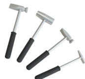
4 aluminium hammere Ref: 020986