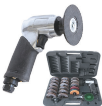
Mini eksentersliper Ref: 051829