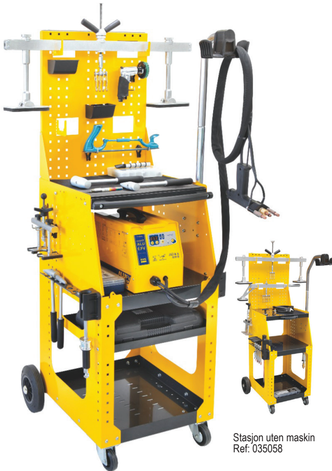
Stasjon uten maskin Ref: 035058

SPEEDLINER ALU E.FV er en komplett bulkrettingstasjon for ALUMINIUM. Perfekt for å reparere små, mellomstore og store bulker ved hjelp av M4, M5 og M6 bolter, gjør denne enheten ideell i reparasjonsarbeid på dører, skjermes og panser osv uten demontering.