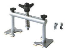
Alu uttrekker Ref. 051003