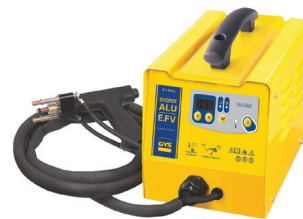
Speedliner Alu E.FV Ref: 021372