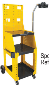
Spot 1600 tralle Ref: 051348