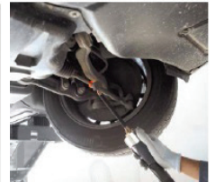
Frigjøring av styring kobling