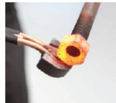
Frigjøring av rustne bolter